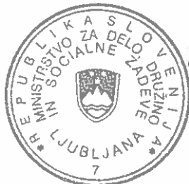
dr. Ivan SVETLIK MINISTER

Aneks št. 4 št. h Kolektivni pogodbi za javni sektor, ki je bil podpisan dne 5. 11. 2010, je vpisan v evidenco kolektivnih pogodb na podlagi 25. člena Zakona o kolektivnih pogodbah pod zaporedno št. 30/4.